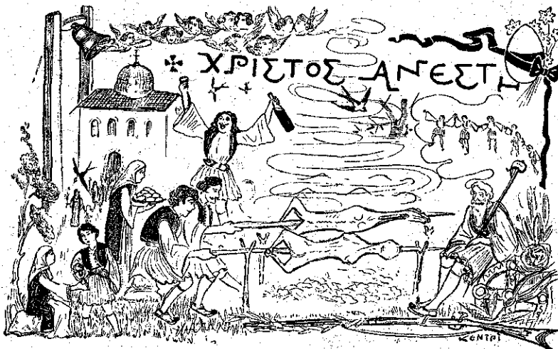
ΚΕΝΤΡΙ (Ἐκτὸς Διαγωνισμοῦ.)

Δεν είμπορώ να εἶπω ὅτι τὸν Διαγωνισμόν μας αὐτὸν ἔσπευεν ἡ μεγαλύτερα ἐπιτυχία. Παλαιότεροι Διαγωνισμοὶ Ζωγραφικῆς, καὶ μάλιστα μετὰ τὸ ἴδιον θέμα, μᾶς ἔδωσαν καλλιτέρα ἀπο-