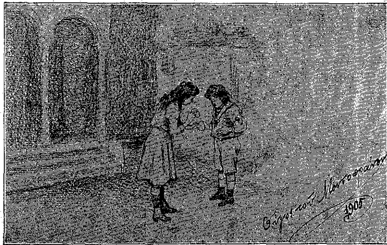
ΟΥΓΟΣ ΤΟΥ ΜΟΝΕΟΠΡΑΝΟΥ (Ἀ Βραβεῖον.)

Ἐρχονται τώρα ἐκεῖνοι, τῶν ὁποίων ἡ ἰδέα καὶ ἡ ἐκτέλεσις εὐρίσκονται εἰς